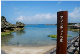
奄美大島北部アマミキヨ降臨の地アマンデー（奄美岳）